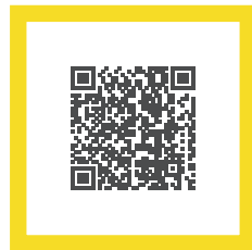
Weitere Informationen zur AKI-Richtlinie