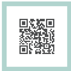
Weitere Informationen zum § 37c Außerklinische Intensivpflege